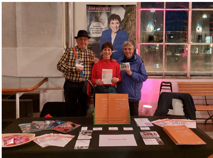
Stand du groupe Babayagas partagé avec le groupe Tamalou et le Projet Seniors LGBTQ+ au BFM le 5 novembre 2025 dans le cadre de l'accueil des nouveaux retraités

L'année 2025 s'est terminée chaleureusement par une sympathique soirée fondue avec le groupe Tamalou !