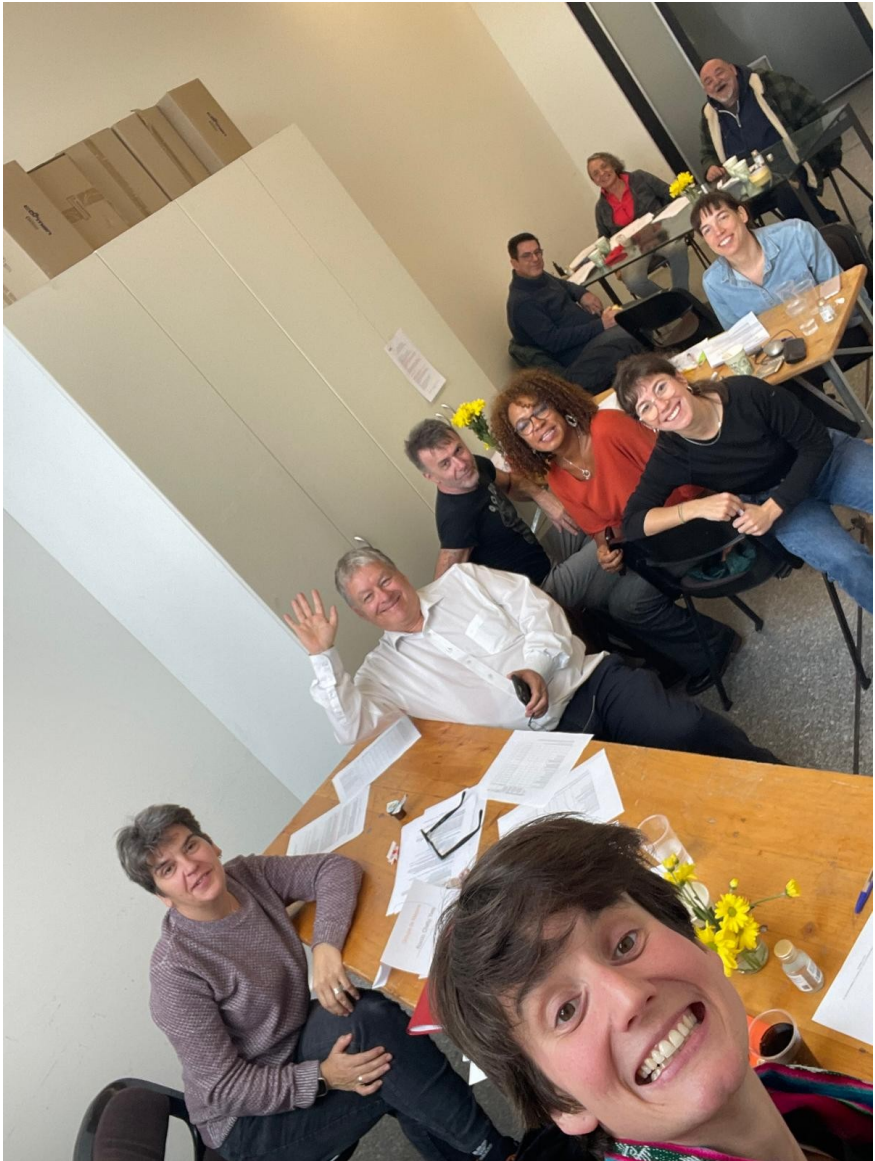
L'équipe 360 presque au complet pour une journée de réflexion et de décisions collectives le 1 er novembre 2025