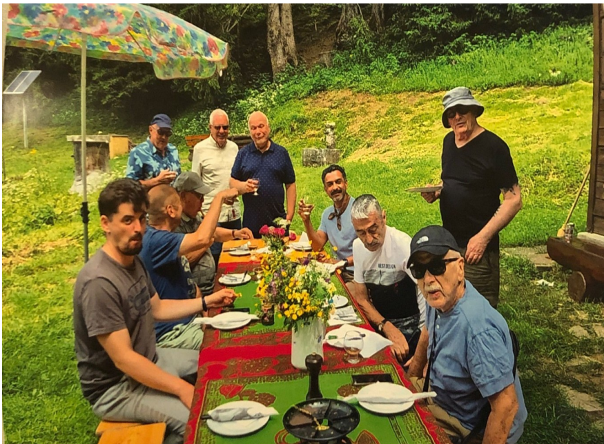
Dégustation au Chalet l'Epi à Gryon (Vaud) le 27 juin 2025

Les visites de villes ou villages rendent le groupe joyeux, peut-être par le fait d'être en plein-air ou de sortir de Genève mais ce type de déplacement implique de partir pour la journée entière. L'activité qui fait l'unanimité de façon évidente est celle de se retrouver pour aller manger la fondue !