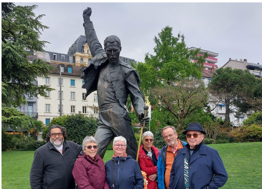
Sortie à Montreux le 7 mai 2025

Des sorties au théâtre ont été organisées au théâtre Le Poche, à la Comédie de Genève et au festival La scène est à nous ! (Théâtre des Grottes), augmentant ainsi le réseau de partenaires culturels déjà existant.