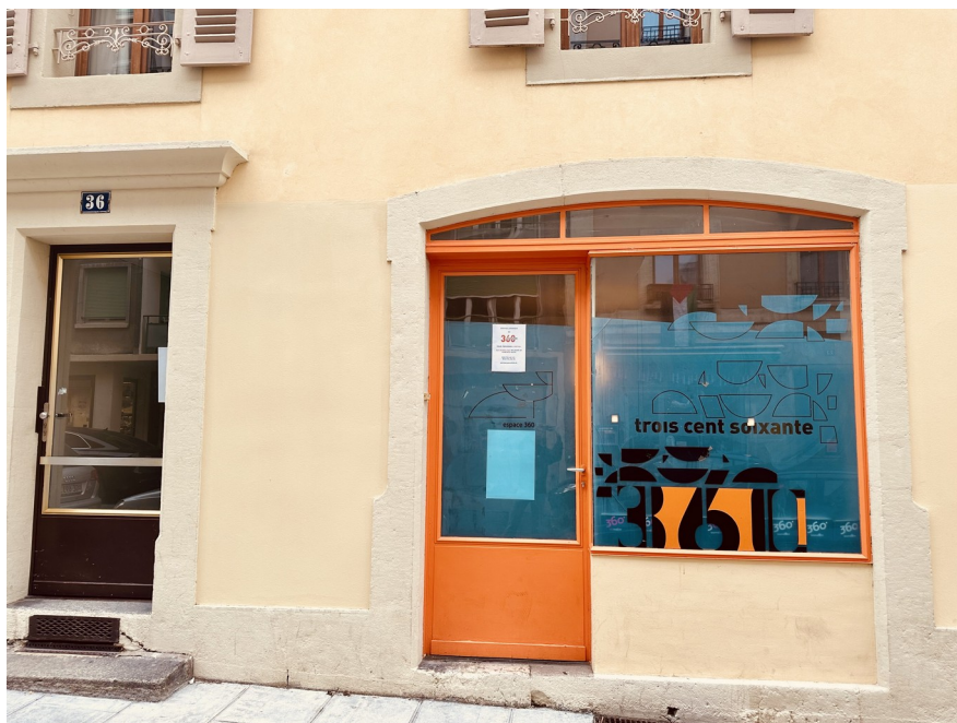
Une des deux vitrines de l'association 360 (local de droite où se tiennent les permanences juridiques)